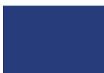
BLU OLTREMARE RAL 5002