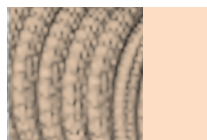
Champagne RAL 1035 Telaio tono su tono