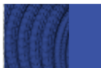
Blu elettrico RAL 5002 Telaio tono su tono