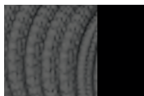
Nero RAL 9005 Telaio tono su tono