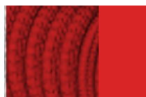
Rosso intenso RAL 3020 Telaio tono su tono