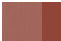
Frassino tinto RAL 3016 Telaio tono su tono