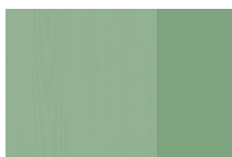
Frassino tinto RAL 6021 Telaio tono su tono