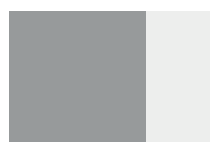
Laminato Fenix Telaio bianco o nero