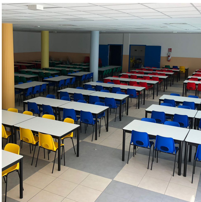
Sedia LARA Tavolo AMBURGO