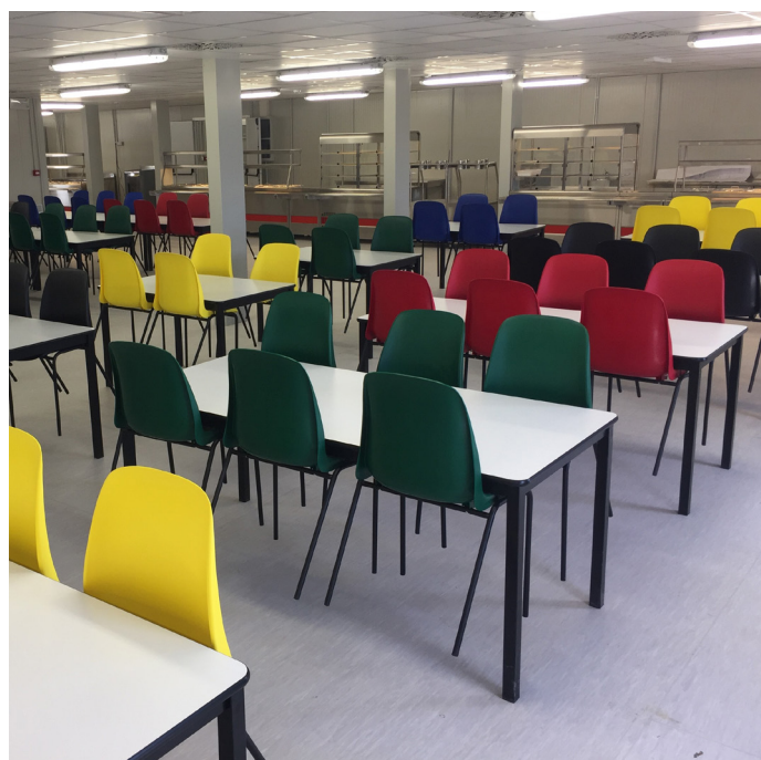
Sedia GAIA Tavolo AMBURGO