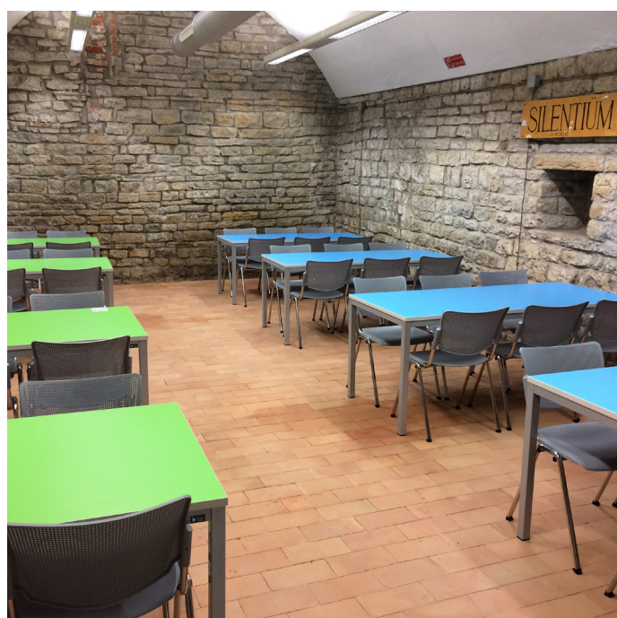
Sedia MILA Tavolo MILANO