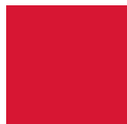
ROSSO tipo RAL 3002