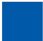
BLU tipo RAL 5005