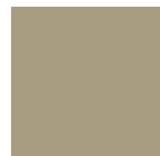
TORTORA tipo RAL 1019