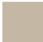
SABBIA tipo RAL 1002