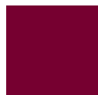
BORDEAUX tipo RAL 3003