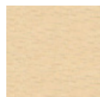
SABBIA tipo RAL 1002