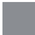
GRIGIO PERLA tipo RAL 7004