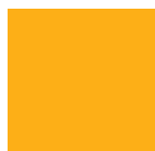
GIALLO tipo RAL 1017