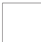
BIANCO RAL 9003