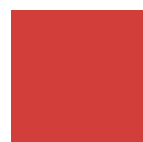
ROSSO tipo RAL 3020