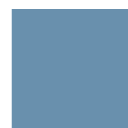
AZZURRO RAL 5014