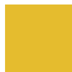
GIALLO RAL 1004