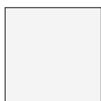
BIANCO RAL 9003