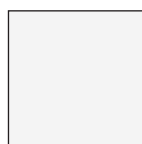
BIANCO RAL 9003