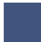
BLU RAL 5023