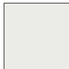
BIANCO RAL 9003