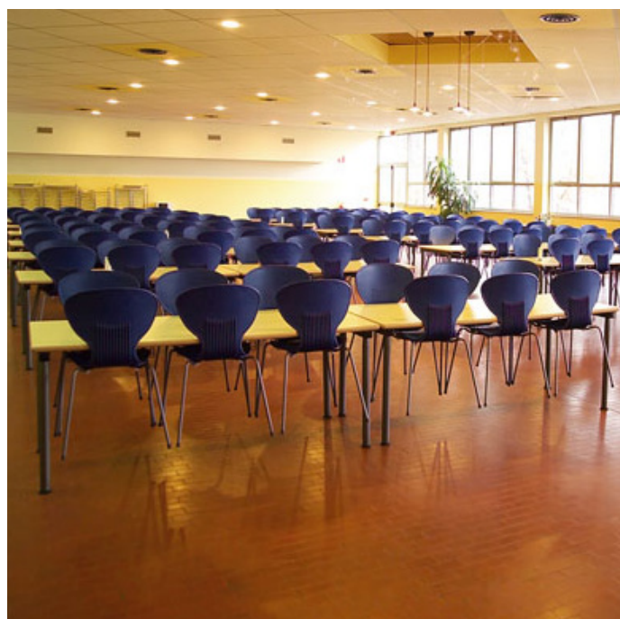
Sedia EMILIA Tavolo AMBURGO