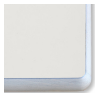
TIPO BANCO Laminato AVORIO Bordo legno 20 mm