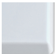
TIPO F Werzalit