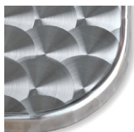
TIPO L Riv. acciaio inox Bordo alluminio