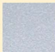
ALLUMINIO GOFFRATO V 09