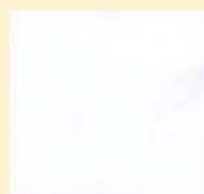
BIANCO RAL 9003 V 15