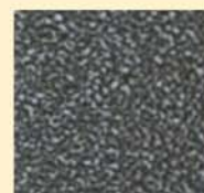
GRIGIO SCURO GOFFRATO V 03