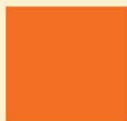
ARANCIO RAL 2004 V 16